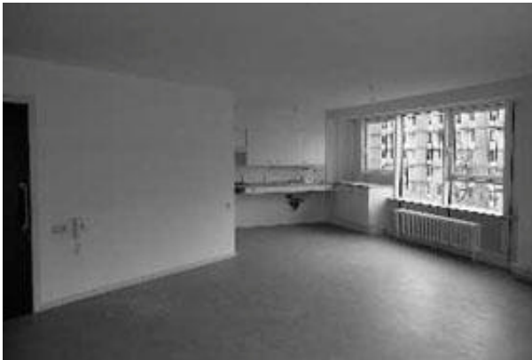
leefruimte en keuken ADL-appartement